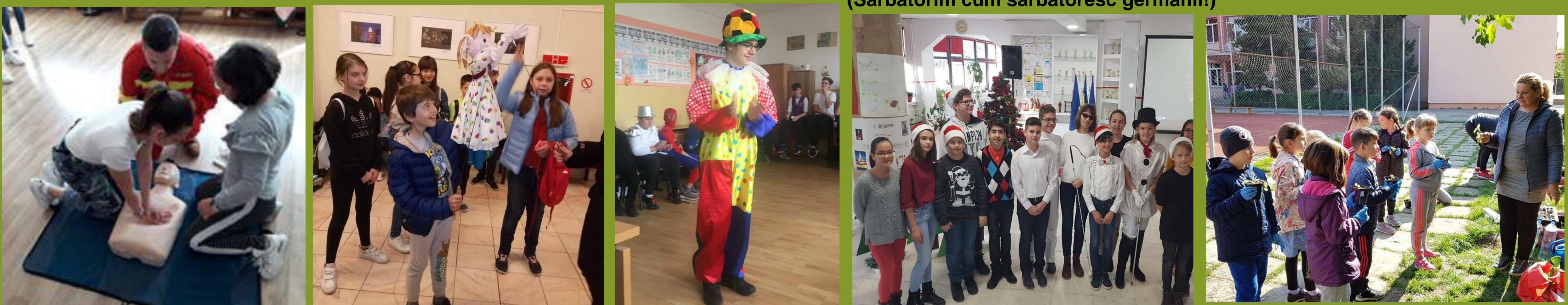
Să plantăm o floare!