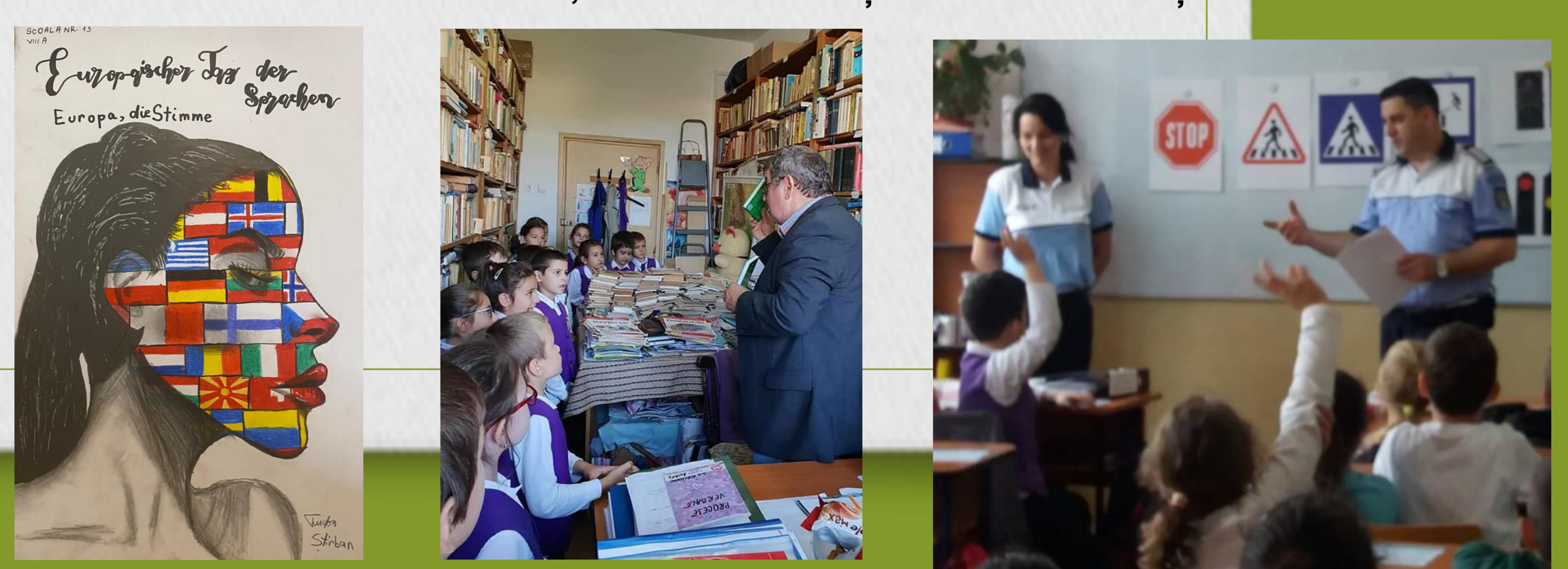
Wir feiern, wie die Deutschen feiern! (Sarbatorim cum sarbatoresc germanii!)